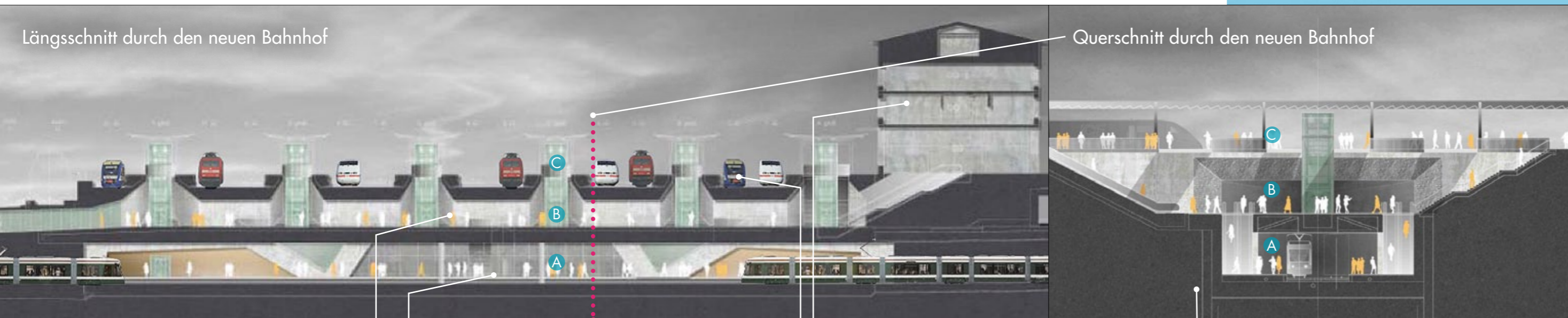
Längsschnitt durch den neuen Bahnhof