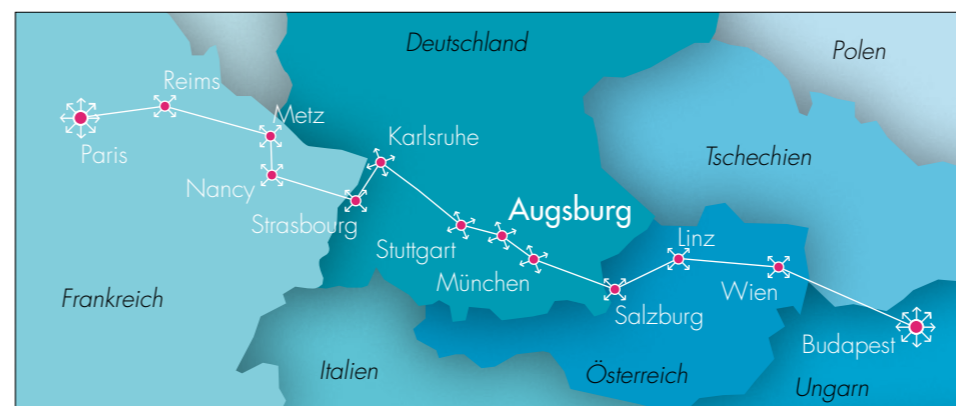
Schnelle Verbindung nach ganz Europa: Augsburg ist Teil der Magistrale Paris – Budapest.

Wichtig 2019 laufen die Fördermittel aus. Daher ist es nötig, mit dem Umbau des Hauptbahnhofs so bald wie möglich zu beginnen und zügig zu bauen.